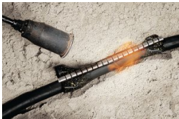
RMS 76-22 450-20022 Reparasjonshylser