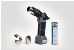
CHG900 391-90010 Gassdrevet varmluftspistol