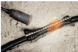
RMS 100-30 450-20031 Reparasjonshylser